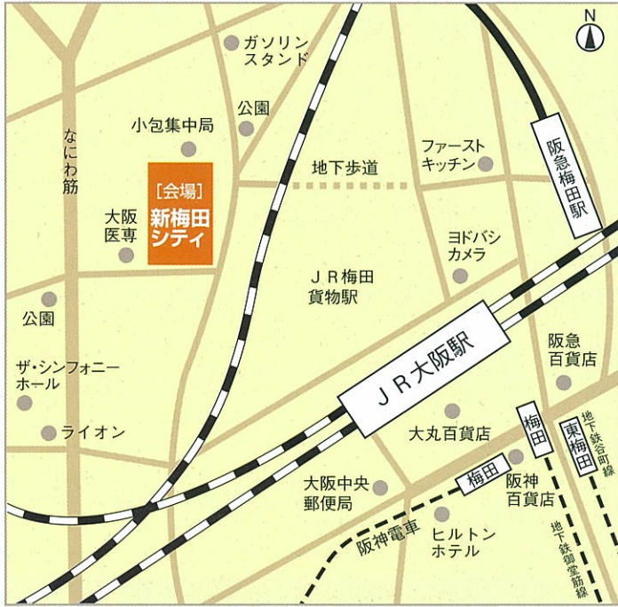
■新梅田シティ周辺俯瞰地図