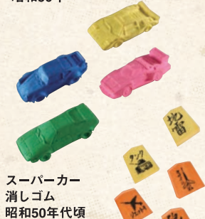
スーパーカー 消しゴム 昭和50年代頃