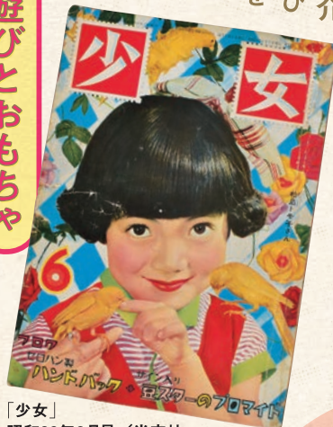
「少女」 昭和29年6月号／光文社

誰しも、子ども時代に夢中になった遊びやおもちゃがあります。それらは成長とともに忘れられ、いつの間にか捨てられてしまふもののでした。しかし、遊びやおもちゃには、それらが生み出された時代の精神や人々の価値観が、縮図のように表されています。遊びやおもちゃは、ひとつの文化遺産ともいえるものです。また、大人にとっては、胸を熱くして遊んだ子どもの頃を思い出す、記憶の発火装置でもあります。 この度の展示では、主に戦後のおもちゃを当時の遊び場の風景の中に配置し、同時代の風俗資料と共に紹介します。懐かしい遊びやおもちゃの展示を通じて、心の底にある子ども時代の記憶を思い出してみませんか。