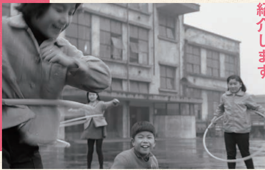
フラフープで遊ぶ子どもたち 昭和36年