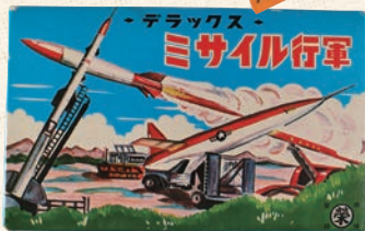
ミサイル行軍 昭和35年頃