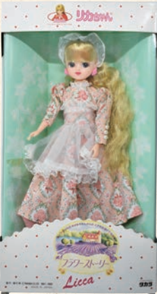
リカちゃん人形 平成元年 © TOMY