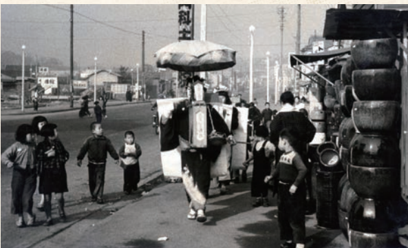
チンドン屋に付いていく子どもたち 昭和28～29年